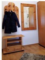
Blick in die Eingangsdielen