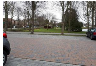
Parkplatz vorm Haus