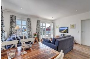
Essplatz mit Blick in den Wohnbereich