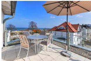
Dachterrasse mit tollem Meerblick