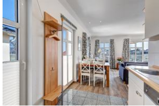
Küchenzeile mit Blick zum Essplatz