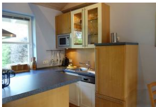
...Spülmaschine, Spülbecken, Kaffeemaschine, Wasserkocher, alles da.