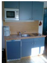
Die Küchenzeile, ausgestattet mit 2-Platten-Ceran-Kochfeld, Mikrowelle und einem Kühlschrank mit Gefrierfach.