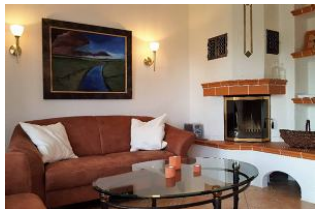
Kamin im Wohnzimmer

Nieblum, zweitgrößter Ort und wohl das schönste Dorf auf Föhr und eines der schönsten Dörfer in Schleswig-Holstein, mit schmucken Friesenhäusern, mächtiger Kirche und einem ruhigen Strand. Nur ca. 10 Minuten zum Strand und 5 Minuten vom Ortskern entfernt liegt dieses schöne Reihenhäuser mit grossem Garten, einer schönen Terrasse in Südlage. Viel Platz bietet Ihnen dieses Haus drinnen und auch draussen. Räumlichkeiten: Erdgeschoss: sep. Küche, Wohnzimmer mit Kamin, Gäste WC, Obergeschoss: 2 Schlafzimmer, Badezimmer mit Dusche Komfort : Geschirrspüler, Mikrowelle, Kamin, Essplatz im Wohnzimmer, Doppelbett, King Size Bett, grosser Garten mit Gartenmöbel, Strandkorb, 2 Fernseher, Waschmaschine, Trockner Untergeschoss: 2. Duschbad Ruhebereich im Dachgeschoss mit TV