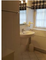
Badezimmer mit Dusche im OG