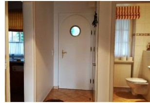
Flur, Gäste WC im EG