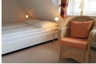
Schlafzimmer mit Doppelbett Einbauschränk und ein weiterer Fernseher