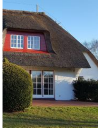
Aussenansicht im Garten aus

Die Unterkunft verteilt sich über UG, EG, 1.OG und 2.OG.