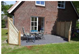
Blick vom Garten auf Terrasse mit Gartenmöbel