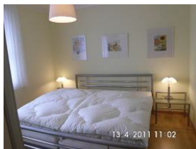
Schlafzimmer mit Doppelbett.