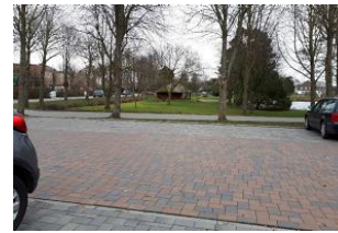
Parkplatz vorm Haus