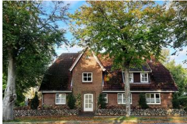
Die Unterkunft befindet sich im EG.

Einladende, gemütliche, ruhig gelegene Ferienwohnung für 4 Personen. Haustiermitnahme auf Rücksprache. 50 qm, abgeschlossene Küche, Wohnzimmer mit Zugang zur Terrasse und einem zusätzlichem Schrankbett, Badezimmer mit Dusche. Schöner Garten mit Liegen und Gartenmöbeln und Grillplatz. Terrasse mit Grillplatz und Gartenmöbel.