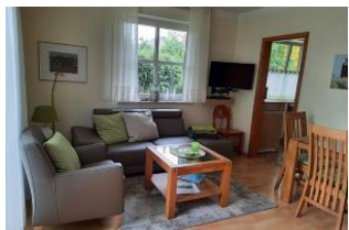
Wohnzimmer mit Esstisch u. 4 Sitzmöglichkeiten