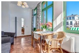
Essen und Wohnen