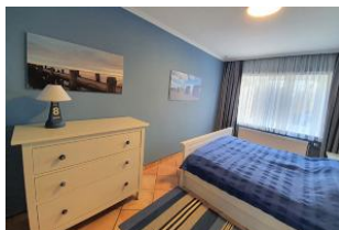
Das Schlafzimmer aus einer anderen Perspektive.