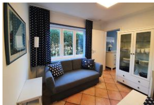
die gemütliche Couch