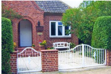
Das Haus von außen