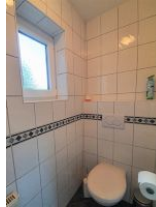
Das WC ist separat.