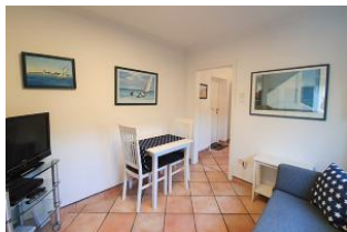
Der Essbereich im Wohnzimmer

Dieses typische rote Backsteinhaus beinhaltet eine kleine Ferienwohnung im EG und liegt nur einen Katzensprung von der Wyker Innenstadt entfernt. Auch das Wellenbad mit seinen Kureinrichtungen liegt in nächster Nähe. Die Wohnung bietet auf ihren 40 qm ein separates Schlafzimmer mit Doppelbett und einen netten Wohn-Ess- Bereich mit vollausgestatteter, offener Küche . Ein lauschiger Gartensitzplatz steht Ihnen im Sommer zur Verfügung. Ihren Pkw können sie auf der öffentlichen Stellfläche in der Mühlenstraße oder kostenfrei am Wellenbad abstellen. Urlaub , wie man es sich wünscht.