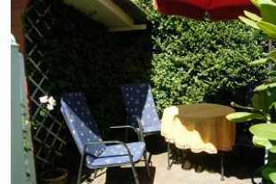
Der gemütliche Sitzplatz im Garten