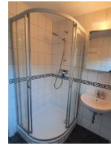
Das kleine Duschbad mit Tageslicht