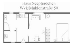
Zeichnung nicht maßstabsgetreu Änderungen unter Vorbehalt.