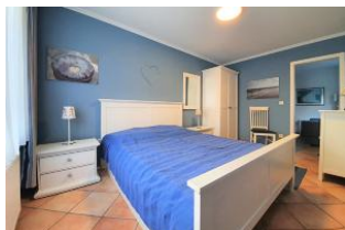
Das komfortable Doppelbett.