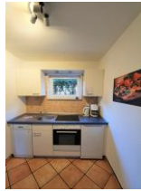
Die kleine aber gut ausgestattete Küche