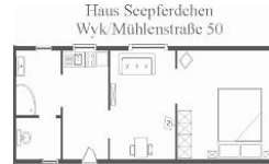
Zeichnung nicht maßstabsgetreu Änderungen unter Vorbehalt.