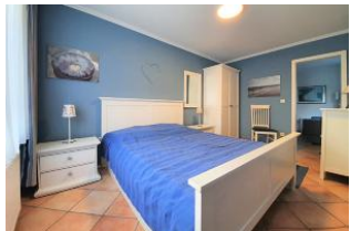
Das komfortable Doppelbett.