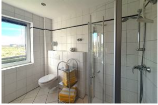
Das helle Duschbad...