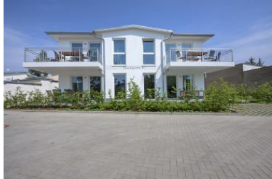
Hausansicht Neubau Villa Margarete