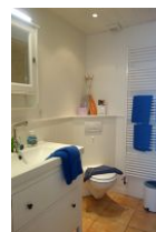
Das Badezimmer im Obergeschoß mit.....