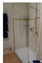
.. großer Dusche, Echtglaswand.