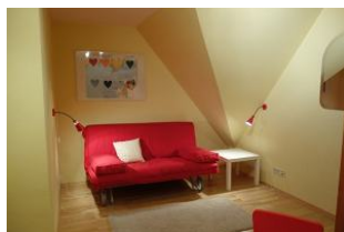
Das Durchgangszimmer mit moderner Couch zum lesen und klönen....