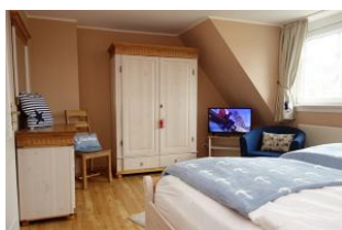
....zur Entspannung noch ein wenig fernsehen ?