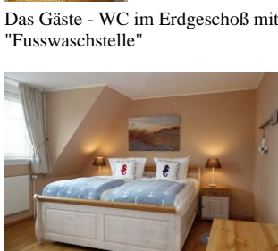
Das Elternschlafzimmer mit großem Doppelbett (180x200cm)