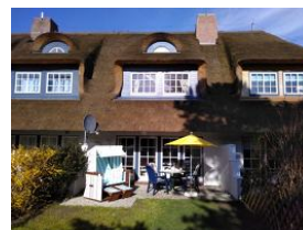
Die Terrasse bei herrlichem Wetter.....