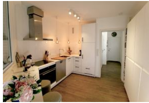
Die Küche ist bestens ausgestattet. Hier macht das Kochen Spaß.