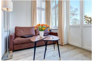
Wohnbereich in der Veranda mit direktem Gartenzugang und dortiger Terrasse