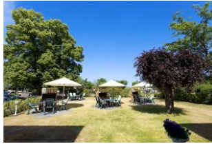
Garten mit Terrassen und Strandkörben (Mai bis September)