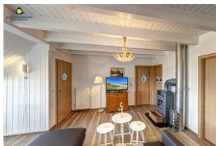
Wohnraum mit Kaminofen