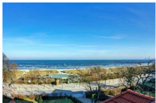
Aussicht von der Empore. Eine Treppe führt vom Wohnzimmer zur Empore, hier 4. Schlafplatz mit Bett 140cm