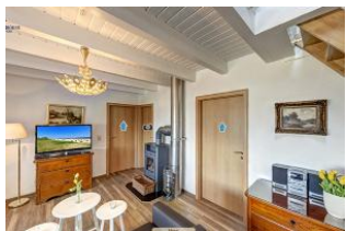
Wohnraum mit Flachbild TV und Kaminofen