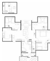
Grundriss mit Empore