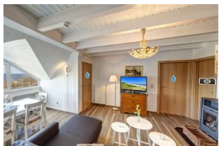
Wohnraum mit Seeblick

Direkt an der Strandpromenade mit phantastischem SEEBLICK und großem SÜDBALKON - das Besondere! Die außergewöhnliche 4-Zimmer-Wohnung mit zusätzlicher Empore nimmt das gesamte 2. Ober- und Dachgeschoss ein (ca. 96 qm). Drei separate Schlafzimmer (2 davon ohne volle Raumhöhe, gut geeignet für Kinder, Bad mit 2- Pers.-Whirlpool-Wanne und großer Dusche, zus. Gäste-WC, Küche, großes Wohnzimmer mit Kaminofen und verglaster Loggia mit Eßplatz und Seeblick sowie ein großer Balkon nach Süden mit Sonne bis abends machen die Wohnung zum Highlight! Das Mobiliar im Wohnzimmer ist teilweise antik, die Wohnung dennoch insgesamt modern und hell. Die Wohnung verfügt über einen Pkw-Stellplatz. Ein Strandkorb am Strand ist incl., eine Garage für Fahrräder und ähnliches (für das gesamte Haus) vorhanden. Im Haus gibt es eine Sauna. es sind vom Haus 50 m zum Strand, ca. 3 Min. zu Fuß ins Zentrum! Tourismusverb.)