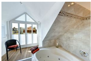
Zugang auf den Balkon