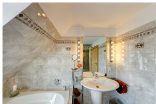
Bad mit Whirl-Badewanne und großer Dusche