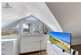
Flachbild TV im Schlafzimmer