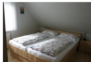
Das freundliche Schlafzimmer bietet erholsamen Schlaf in dem ruhigen Örtchen Utersum.