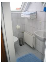
Das Badezimmer mit Dusche