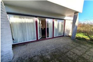
Die Terrasse der Wohnung.

Waschmaschine und Trockner stehen für unsere Gäste bereit.