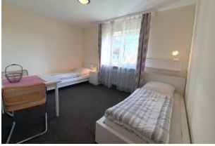
Das dritte Schlafzimmer mit zwei Einzelbetten.