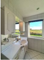
...mit Blick auf die Salzwiesen.