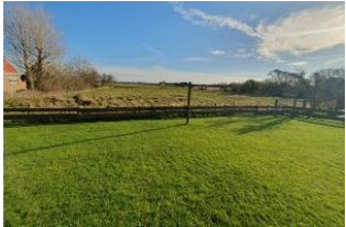
Ihr kleiner Garten.