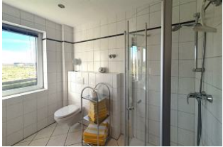
Das helle Duschbad...