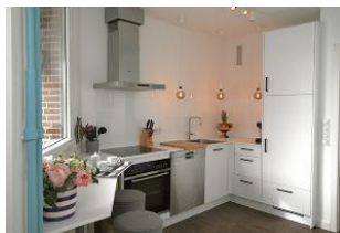
Die moderne Küche.