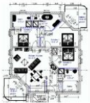
Wohnungsgrundriss (Möblierung exemplarisch)

STRANDNAH, GROSS, MODERN! Mit 2 BALKONEN (je ca. 11 qm), FAHRSTUHL, SAUNA und nur ca. 100 m zur STRANDPROMENADE! Großzügige elegante 4 - Zimmer - Wohnung mit sehr guter Ausstattung! 3 separate Schlafzimmer, 3 Bäder (2 davon ensuite), alle mit Fußbodenheizung. Die ensuite-Bäder verfügen über Wanne und Dusche bzw. Dusche. Das dritte Bad ist ein Saunabad mit Saunakabine und Schwalldusche. Der große Wohnbereich verfügt über eine vollausgestattete Küchenzeile, einen Eßbereich und einen Couchbereich mit KAMINOFEN. Die Balkone sind möbliert. Zur Wohnung gehört ein STRANDKORB AM STRAND. Die Wohnung verfügt über einen Pkw-Stellplatz in der teilüberdachten Tiefgarage. Fahrradabstellfläche ist vorhanden. Vom Haus aus können Sie das Ortszentrum und die bekannte Ahlbecker Seebücke in ca. 2 Minuten zu Fuß erreichen.