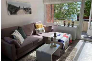
Die Unterkunft befindet sich im 3.OG.

Die Wohnung Luett Lee im Huus in Lee am Sandwall 60 liegt nur 50 m vom Hauptstrand entfernt in zweiter Reihe und sehr zentral gelegen, am ruhigen Ende des lebhaften Ortszentrums und der Flaniermeile Sandwall. Vom Fähranleger sind es nur 750 m (10 Minuten zu Fuß oder ganz bequem per Taxi, mit Gepäckservice auf Anfrage). Die 43 m 2 große, lichtdurchflutete Wohnung Luett Lee liegt im 3. OG des Hauses (Endetage) und lädt Sie/Euch auf dem großen Ost-Balkon zum sonnigen Frühstück ein. Der großzügige Wohnbereich mit einem kuscheligen Lounge-Sofa, der bequeme Essbereich und die komplett ausgestattete Küchenzeile mit Nespresso Kaffeemaschine ermöglichen Wohlbehinden zu allen Jahreszeiten. Das separate Schlafzimmer mit Doppelbett verfügt über einen (kleinen) begehbaren Kleiderschrank. In dem modernen Duschbad sorgt ein großes Fenster für viel Tageslicht und die elektrische Handtuchheizung bei Bedarf für wohlige Wärme. Smart-TV (32, Full HD, Netflix, Amazon Prime), eine HiFi-Music-Station (Streaming, DAB+, UKW, CD, USB) und ein sehr schnelles WLAN (100 MBit/s) bieten allerbestes Entertainment mit der Option auf entspanntes mobiles Arbeiten im Urlaub. Weitere Ausstattungsmerkmale: