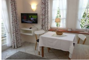
Esstisch und TV Gerät