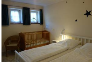
Großes Doppelbett und Holzbabybett...