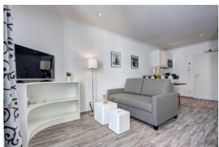
TV und Couch