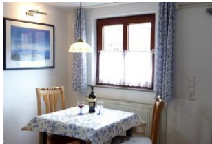
Der Essbereich mit Ausblick nach draußen.