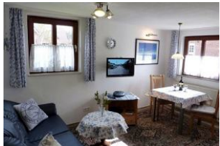
Ihr heller Wohn- und Essbereich.

Im Anbau dominieren blaue Möbel im friesischen Stil. Besonders geeignet für preisbewusste Singles, die in einer ruhigen und dennoch zentralen Gegend wohnen möchten. Ein kleines "Ferienhaus" mit direktem Zugang zum Garten und einer gemütlichen Sitzmöglichkeit auf der sonnigen Südseite.