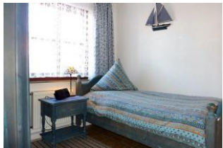
Der ruhige Platz zum Träumen.