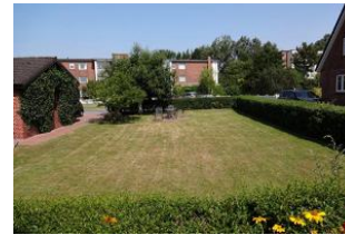
Der herrliche Außenbereich.