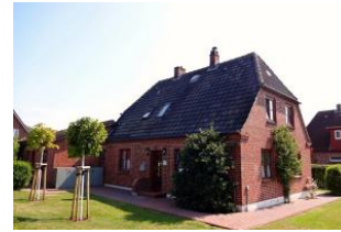
Der Anbau befindet sich links vom Haus. Sie haben einen direkten Ausgang in den wunderschönen Garten.