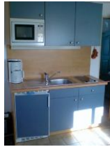
Die Küchenzeile, ausgestattet mit 2-Platten-Ceran-Kochfeld, Mikrowelle und einem Kühlschrank mit Gefrierfach.