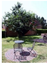
Ihr eigener Sitzbereich an der Südseite.