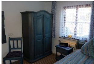
Viel Stauraum für Ihr Gepäck.