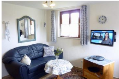
Der liebevoll eingerichtete Sitzbereich für gemütliche Stunden.