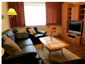
...großem Flachbild-Fernseher im Wohnzimmer EG