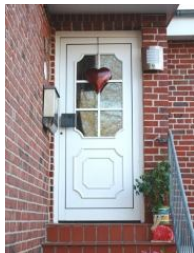
Ihr Eingang zur Urlaubsreise! Die Ferienwohnung befindet sich im Hochparterre.

Die Unterkunft verteilt sich über EG, 1.OG und 2.OG.