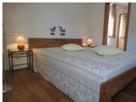
neues, geschmackvolles Schlafzimmer im 1. OG mit Doppelbett, ...