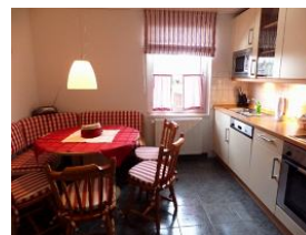
Komfort-Küche mit geräumigem Essplatz EG