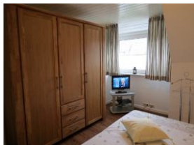
... reichlich Platz für Ihre Garderobe und Flachbild-TV