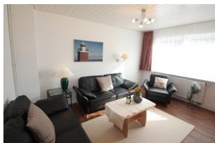
gemütlicher Wohnraum mit zwei Ledersofas und Sessel sowie...