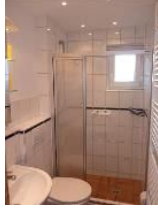
... mit großem Duschbereich