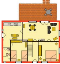
Der Grundriss der Wohnung im Erdgeschoss.