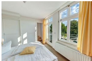
Wohnbereich, Blick in das Schlafzimmer mit Empore

STRANDNAH mit SÜDBALKON! Nur ca. 100 m zur Strandpromenade! Schönes gemütliches Maisonette-Apartment mit 2 Zimmern und zus. Schlafrum auf der Empore, gute Ausstattung. Separates Schlafzimmer, zus. Maisonette-Schlafrum, Wohnzimmer mit Küchenzeile und Essplatz, Duschbad, Südbalkon. Die Wohnung verfügt über einen Pkw-Stellplatz. Abstellraum für Fahrräder und ähnliches ist vorhanden. Eine Sauna in der "Villa Germania" kann kostenpflichtig genutzt werden. Vom Haus aus können Sie das Ortszentrum und die bekannte Ahlbecker Seebücke in ca. 3 bzw. 5 Minuten zu Fuß erreichen.