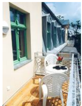
Großer Süd - Balkon