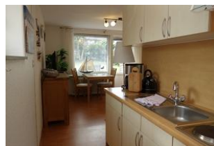
Die Küchenzeile vom Schlafzimmer aus Richtung Wohnzimmer.