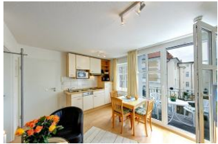
Küche mit Esszimmer

Direkt an der Strandpromenade mit SÜDBALKON und FAHRSTUHL im Haus! Schönes geräumiges 2-Zimmer-Apartment mit geschmackvoller guter Ausstattung. Separates Schlafzimmer (mit Fernseher), Wohnzimmer mit Küchenzeile und Essplatz, Duschbad, Balkon nach Süden mit Sonne bis abends. Die Wohnung verfügt über einen Tiefgaragen-Pkw-Stellplatz. In der Garage können auch Fahrräder und ähnliches untergestellt werden. In unserer "Villa Germania" nebenan gibt es eine Sauna. Von der "Villa Aquamarina" aus können Sie das Ortszentrum und die bekannte Ahlbecker Seebrücke in ca. 3 Minuten zu Fuß erreichen. Zum Strand sind es 50 m.