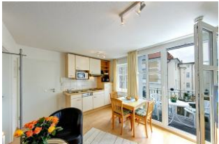
Küche mit Esszimmer

Direkt an der Strandpromenade mit SÜDBALKON und FAHRSTUHL im Haus! Schönes geräumiges 2-Zimmer-Apartment mit geschmackvoller guter Ausstattung. Separates Schlafzimmer (mit Fernseher), Wohnzimmer mit Küchenzeile und Essplatz, Duschbad, Balkon nach Süden mit Sonne bis abends. Die Wohnung verfügt über einen Tiefgaragen-Pkw-Stellplatz. In der Garage können auch Fahrräder und ähnliches untergestellt werden. In unserer "Villa Germania" nebenan gibt es eine Sauna. Von der "Villa Aquamarina" aus können Sie das Ortszentrum und die bekannte Ahlbecker Seebrücke in ca. 3 Minuten zu Fuß erreichen. Zum Strand sind es 50 m.