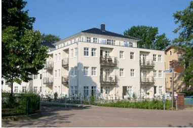
Hausansicht "Villa Aquamarina" von der Promenade