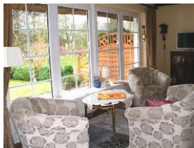
Wohnbereich mit Zugang zum schönen grossen Garten mit Teich

Nieblum ? zweitgrößter Ort und wohl das schönste Dorf auf Föhr und eines der schönsten Dörfer in Schleswig-Holstein, mit schmucken Friesenhäusern, mächtiger Kirche und einem ruhigen Strand. Nur ca. 10 Minuten zum Strand und 5 Minuten vom Ortskern entfernt liegt dieses schöne Reihenhäuser mit eigenem grossen Garten und kleinem umzäunter Teich und schöner Terrasse viel Platz bietet Ihnen dieses Haus drinnen und auch draussen. Räumlichkeiten: Erdgeschoss: separate Küche, Wohnzimmer mit Kamin, Gäste WC, Obergeschoss: 2 Schlafzimmer neu renoviert mit Laminat, Badezimmer mit Badewanne Komfort: Geschirrspüler, Mikrowelle, Kamin, Essplatz im Wohnzimmer, Badewanne, 1 Doppelbett, 2 Einzelbetten, grosser eigener Garten mit Teich, Gartenmöbel, Fernseher, Waschmaschine