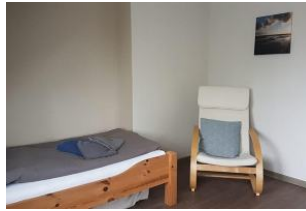
1 Schlafzimmer mit getrennten Betten und ein Schlafzimmer mit grossem Doppelbett