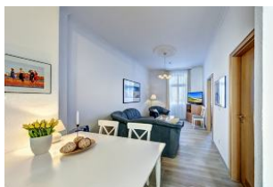
Wohnraum mit direktem Zugang zum Garten und dortiger Terrasse