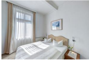
Schlafzimmer 1 mit Zugang zum Balkon