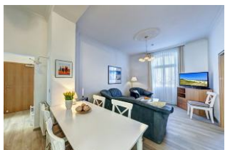
Wohnraum mit direktem Zugang zum Garten und dortiger Terrasse

Direkt an der Strandpromenade mit großem GARTEN und SÜDBALKON! Schönes komfortables 4 - Zimmer - Apartment mit guter und vollwertiger Ausstattung. Drei separate Schlafzimmer, separate Küche, zus. Essplatz im Wohnraum, Duschbad und Gäste-WC, Wohnraum mit direktem Gartenzugang und Terrasse, Südbalkon mit Sonne bis abends. Die Wohnung verfügt über einen Pkw-Stellplatz. In der Garage können Fahrräder und ähnliches untergestellt werden. Im Haus gibt es eine Sauna. Von der "Villa Germania" aus können Sie das Ortszentrum und die bekannte Ahlbecker Seebrücke in ca. 3 Minuten zu Fuß erreichen. Zum Strand sind es 50 m. Von Mai bis September ist ein Strandkorb im Tagespreis enthalten!