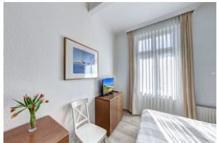
Schlafzimmer 1 mit Zugang zum Balkon