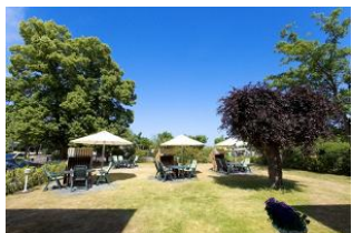
Garten mit Terrassen und Strandkörben (Mai bis September)