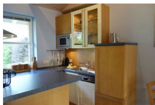
...Spülmaschine, Spülbecken, Kaffeemaschine, Wasserkocher, alles da.