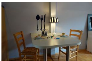
Der Essplatz vor der Küche