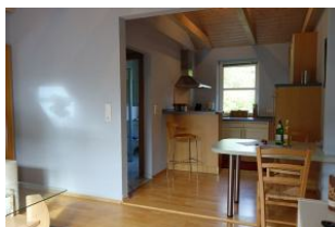
Der Blick in die Küche mit kleinem Tresen, dahinter verbirgt sich das Ceranfeld mit 4 Kochfeldern und der Backofen.