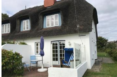
Die Unterkunft verteilt sich über EG und 1.OG.

Das Reetdachhausteil liegt in exponierter ruhig Lage, in einer Sackgasse, mit einem grossen Garten können Sie hier relaxen und entspannen und sie haben einen unverbauten Blick in einer aussergewöhnliche Lage mit Deichblick. Das gemütliche Haus besteht aus einem Wohnzimmer mit Kamin und direktem Zugang zum Garten mit Strandkorb, die Küche ist sehr gut ausgestattete mit Mikrowelle, Geschirrspüler und allem was man benötigt, im Erdgeschoss gehen sie auf warme Terracottafliesen Ein Badezimmer mit Dusche befindet sich im Erdgeschoss und das zweite Badezimmer mit Badewanne und Doppelwaschtisch, Bidet im 1 OG. Im 1 OG haben Sie zwei Schlafzimmer mit jeweils einem 1,60 Bett für 2 Pers. Im 2. OG haben Sie einen kleinen Ruheraum als Rückzugsort.