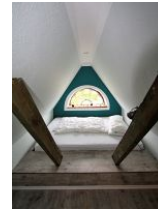
Der wohl schönste Schlafplatz im Kinderzimmer.