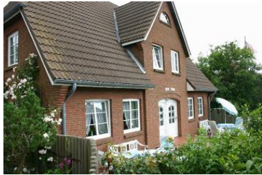
Die Unterkunft befindet sich im 1.OG.

Die Außenansicht des schönen Friesenhauses mit den insgesamt 4 Wohnungen. Diese Ferienwohnung ist in spiegelverkehrter Form im Haus ein weiteres Mal auf derselben Etage vertreten. Sprechen Sie uns bei Bedarf gerne an.