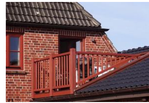
Der gemütliche Balkon ...