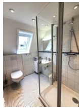
Das helle Duschbad bietet genügend Platz für die ganze Familie.