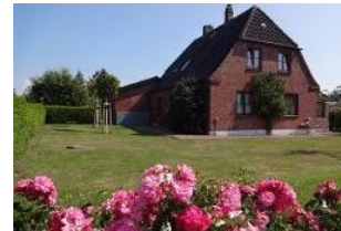
Ein großer Garten lädt zum Entspannen ein.