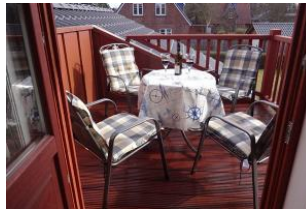
... lädt zu gemeinsamen Stunden ein.