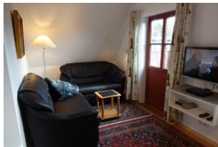
Ihre gemütliche Sitzcke.