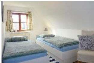
Das zweite Schlafzimmer mit getrennten Betten, z.B. für die Kinder.

Für preisbewusste Familien mit bis zu 2 Kindern ist diese Wohnung besonders geeignet. Bereits morgens scheint die Sonne ins Wohnzimmer und begrüßt die Gäste zum Frühstück am Esstisch. Abends lädt eine Sitzcke mit einem Sofa und zwei Sesseln zum Spielen oder Fernsehen ein.