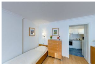
Schlafmöglichkeit für 3. Person