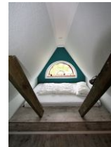
Der wohl schönste Schlafplatz im Kinderzimmer.