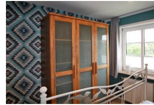
Der Kleiderschrank im Schlafzimmer