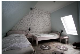
Das zweite Schlafzimmer mit drei Einzelbetten liegt im 2. Obergeschoss.