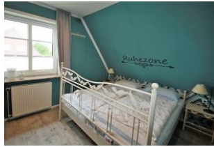
Für erholsamen Schlaf sorgt das liebevoll eingerichtete Schlafzimmer.