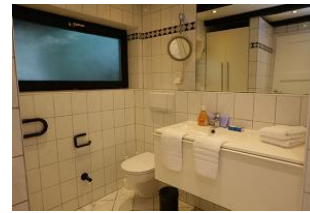
Das zweite Bad mit Handwaschbecken, Toilette und...