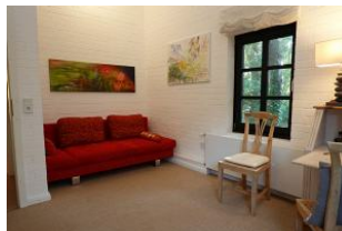
...und Schlafcouch, falls noch Besuch kommt.