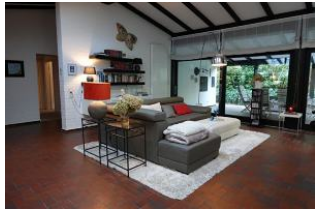
...hier noch einmal von der anderen Seite.