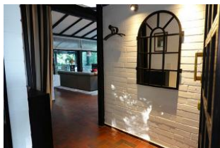
...treten Sie ein und lassen sich verzaubern