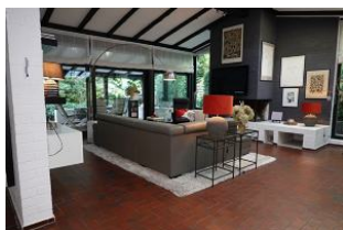
...die große Couchecke