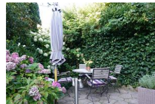
Der bestuhlte Terrassenplatz.