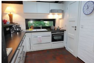
...die Küche mit kleiner Speisekammer,