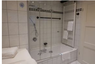
...Badewanne mit Duschköglichkeit.