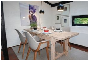
...nehmen Sie Platz, der Tisch ist schon gedeckt.