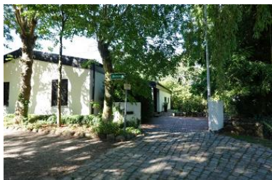
Das Haus Reidschott 9 in Boldixum