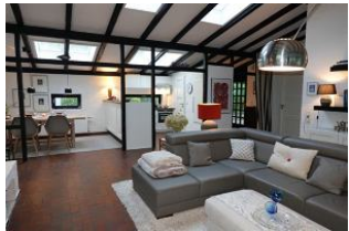
...der Blick Richtung Küche und Essplatz