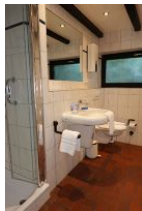
Ein Bad mit Handwaschbecken, Toilette und ..