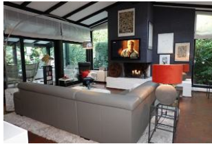
Das TV Gerät