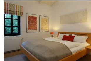
Ein Schlafzimmer mit Doppelbett 180x200cm ohne Fußteil und ...