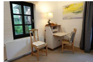
Das Arbeitszimmer für die ganz Fleissigen...