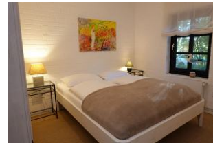
Das zweite Schlafzimmer mit Doppelbett 160x200cm ohne Fußteil und...