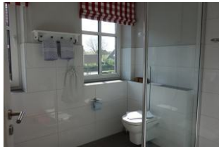
... Toilette und ...