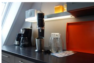
....kein-Flaschen-schleppen mehr ! Ein Soda Stream mit Echtglas-Flaschen.....