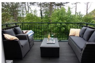
....entspannend, der Balkon mit Lounge Möbeln