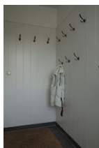
Vorflur und Garderobe zur Whg. 10

...wer ist eigentlich "Paul" ? Unsere Häuser Paul und Paula stehen dort, wo einmal die Pension "Vier Jahreszeiten" stand. Eine großzügige Wohnung über zwei Etagen und mit allem Komfort erwartet Sie im Haus Paul. Man spürt, hier wurde jedes Möbelstück einzeln ausgesucht. Mit viel Liebe zum Detail entstand hier eine Farbharmonie, wie man sie selten findet. Gemütliche Sitzmöbel wie die Couch mit verstellbaren Rückenlehnen, ein Pöng von IKEA, wie wir ihn alle kennen, bequeme Stühle am Esstisch, und, und, und. Sehen Sie selbst und fühlen Sie sich wohl, wir haben unser Bestes gegeben. Perfekt auch für Golfer. Die Entfernung zum Golfplatz beträgt nur 2,6 km