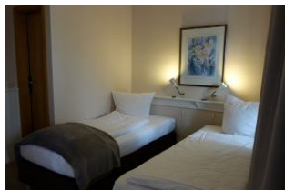
..hier noch einmal die Betten, die auch mühelos zusammen gestellt werden können.

Entfernungen, zirka: zum Bäcker 30 m, zur Einkaufsmöglichkeit 350 m, zum Flugplatz 3,0 km, zum Golfplatz 3,0 km, zum Hafen 600 m, zum Meer 50 m, zum Badstrand 50 m, zum Ortszentrum 50 m