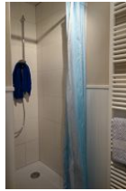
... geräumiger Dusche (flacher Einstieg).