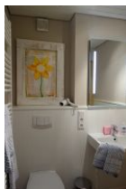
Das neu gestaltete Bad mit viel Ablagefläche und ....