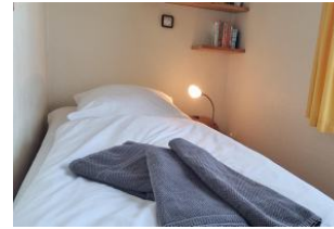
Schlafzimmer mit Einzelbett