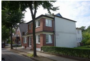
Das Haus Hallig Hooge von der Seite, früher war das Haus eine Pension