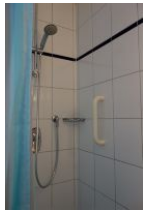
Die Dusche mit Haltegriff.