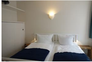
Das Doppelbett 190x200cm und der Einbauschränk.