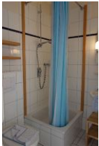
Noch einmal die Dusche mit hoher Wanne !