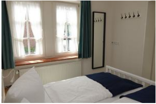
Im Schlafzimmer ein großer Spiegel