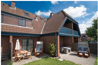
Kliffkoje No 1 und No 2 Terrassen

Gemütlich, hell, strandnah und modern. Ideal für 2-3 Erwachsene oder Familien mit 2 heranwachsenden Kindern ab 4 Jahren. Die Kliffkoje wurde komplett, inklusive neuer Küche und Badezimmer renoviert und mit Liebe neu eingerichtet. Durch die gute Aufteilung der Räume über zwei Etagen bietet dieses kleine Haus genug Platz, um sich wohl zu fühlen. Die zwei Schlafzimmer (mit einem Doppelbett 2 Einzelbetten; und davon ein Hochbett bis zu einer Körpergröße von max. 160 cm) liegen im OG. Das angrenzende Badezimmer mit WC und Duschkabine ist klein, aber fein. Im Erdgeschoss befindet sich ein kleiner Eingangsbereich, von dem aus Sie in das helle und schön eingerichtete Wohnzimmer mit Esstisch sowie integrierter, gut ausgestatteter Küche gelangen. Von der sich an das Wohnzimmer anschließenden Terrasse mit Gartenmöbeln haben Sie direkten Zugang zum Garten. Im hauseigenen Strandkorb genießen Sie auch bei einer steifen Brise die gute Nordseeluft. .