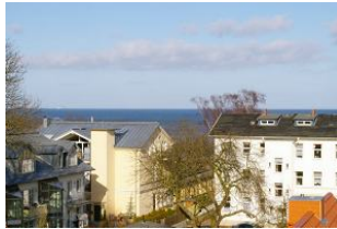
Seeblick vom Balkon