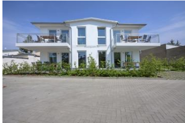
Hausansicht Neubau Villa Margarete