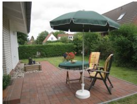
Die Terrasse ist gleichzeitig der Eingang zur Wohnung