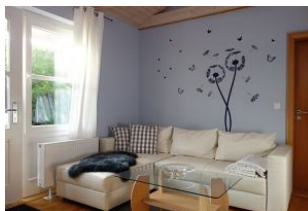
....nehmen Sie Platz....