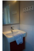
Auch im Dachgeschoß befindet sich ein kleines Bad mit Waschtisch, Toilette (nicht im Bild) und...