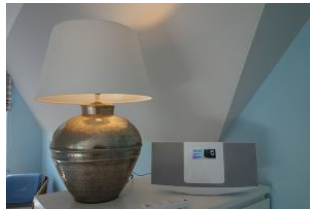
...und eine Musikanlage.