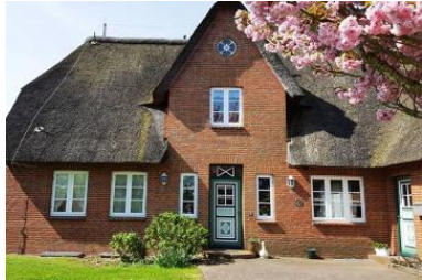
Haus Faltings in ruhiger Lage im Ortsteil Goting mit 3 Wohneinheiten