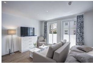
Flachbild TV und Couch